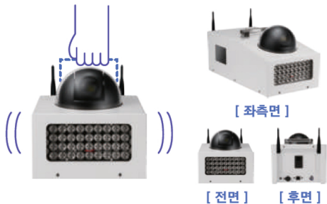
스탠다드 모델 _ 375*190*140mm / 중량 : 5kg