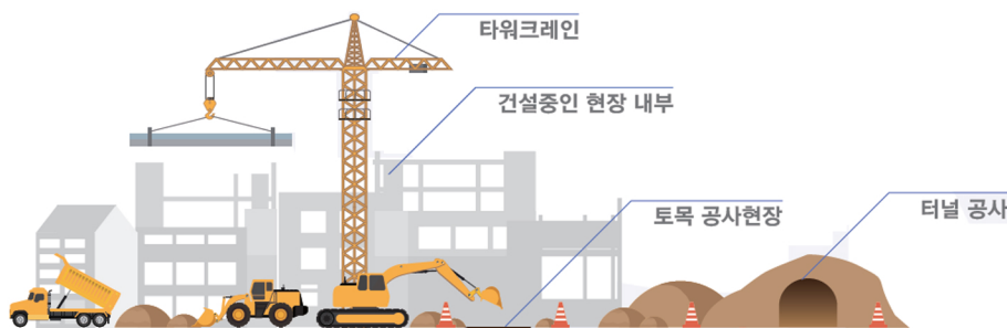
산업현장 및 토목, 건축 공사 현장 등

산업 현장에서 사각지대 없이 모니터링하고 카메라 설치가 어려운 지역에 활용할 수 있는 카메라로, 100m 거리의 사물을 식별 가능한 광학 (12배속) 줌 렌즈를 통해 선명하고 디테일한 영상은 물론 강력한 리튬 배터리 탑재로 이동중 모니터링을 할 수 있는 제품입니다.