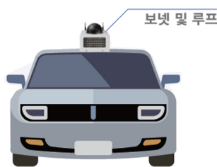
차량 부착 예시