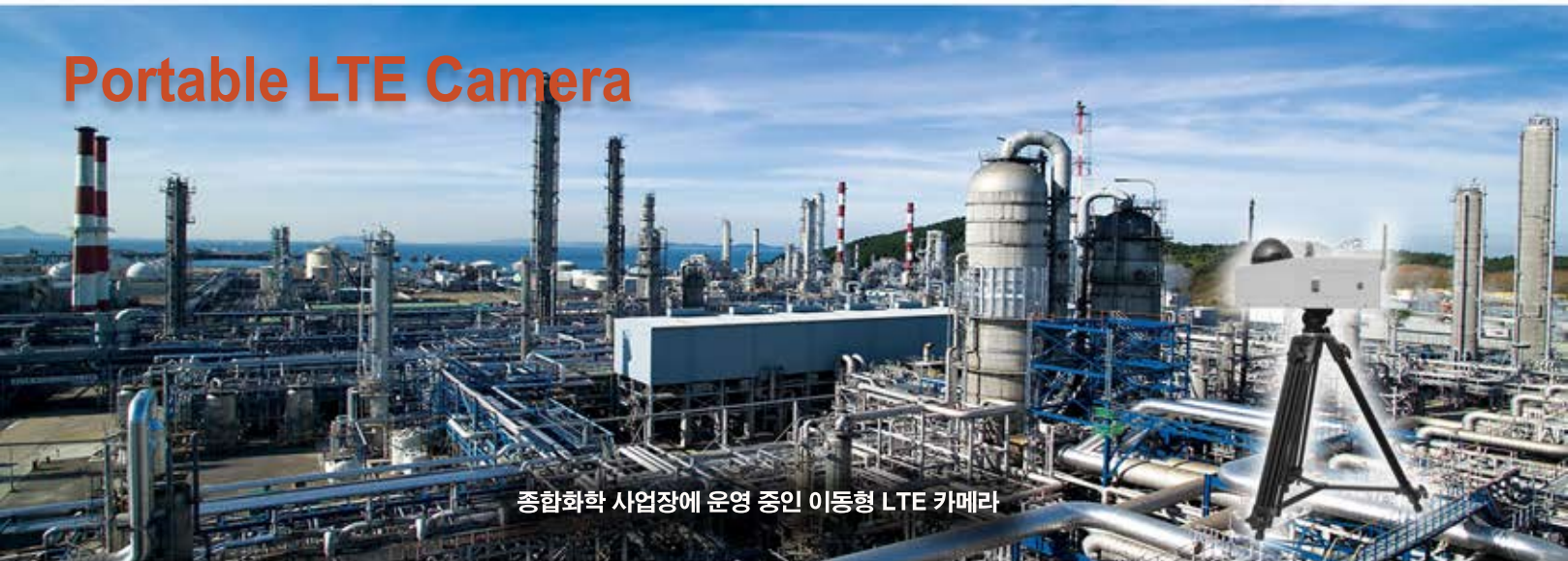
종합화학 사업장에 운영 중인 이동형 LTE 카메라