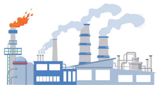
화학단지 / 발전소 / 변전소