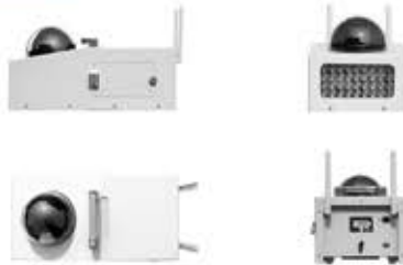
사이즈 : 375 x 190 x 140 mm / 중량: 5.0 Kg